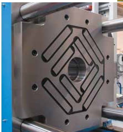
M-TECS 120 – wymiana narzędzi w krótszym czasie