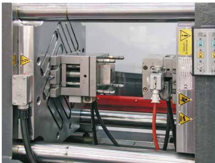
Małe narzędzia są również właściwie zamocowane. Efekt koncentracji podłużnych pól generuje maksymalną siłę magnetyczną i kieruje ją do płyty bazowej narzędzia. Maszyna MF 110 Electra, siła magnetyczna 8 t

Systemy można stosować we wszystkich typach maszyn (pionowych i poziomych), i są łatwe w montażu. Stosunkowo niskie koszty inwestycji oraz efektywne i relatywnie krótki czas amortyzacji mogą przekonać tych przedstawicieli branży przetwórstwa tworzyw sztucznych, którzy stawiają na elastyczność i szybkość procesu produkcji.