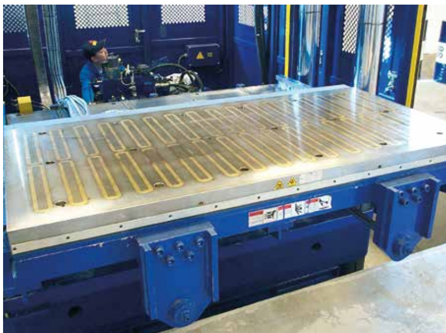
System mocowania magnetycznego w prasie poziomej dla temperatur do 240 °C

Także duże narzędzia mocuje się w bezpieczny sposób przy użyciu dużych sił. Wymianę narzędzia w maszynach o różnej wielkości można przeprowadzić dosłownie w kilka minut. Masywne łączniki pomiędzy biegunami nadają konstrukcji znaczną sztywność. Ma to szczególne znaczenie dla poprawienia jakości procesu produkcji oraz wpływ na zmniejszenie zużycia narzędzi i redukcję kosztów ich utrzymania.