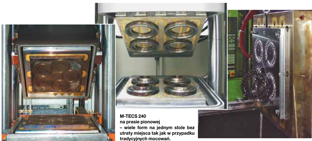
M-TECS 240 na prasie pionowej – wiele form na jednym stole bez utraty miejsca tak jak w przypadku tradycyjnych mocowań.