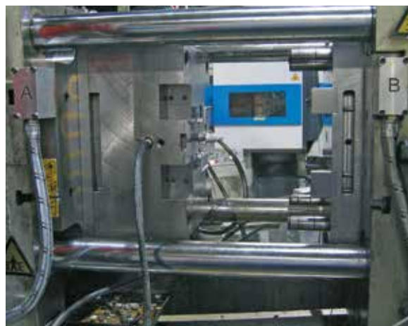
System mocowania magnetycznego w odlewniczej maszynie ciśnieniowej CC-125, siła zamknięcia 1500kN, siła magnetyczna 110kN, Zakres temperatur do 240°C