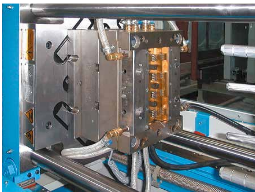
Wtryskarka do tworzyw sztucznych z M-TECS 120