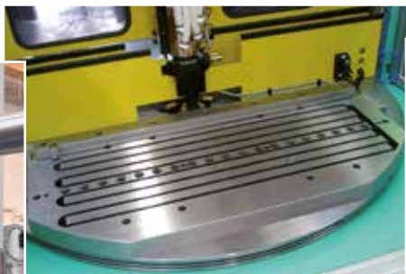
M-TECS 120 – na pionowej maszynie ze stołem obrotowym