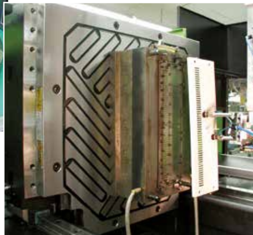
M-TECS 120 – efekt koncentracji siły mocowania M-TECS w technice podłużnych pól magnetycznych kieruje siłę magnetyczną dokładnie w powierzchnię mocowania narzędzia.